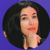
Vice-Présidente RÉGION GRAND EST