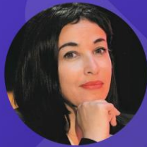
Vice-Présidente Déléguée à la compétitivité, à l'innovation et au numérique Région Grand Est

Marchés publics et innovation : Quels outils pour les acheteurs ? Quelles opportunités pour les entreprises ?