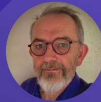
Hervé FORMELL Chef du service Appui aux politiques d'achats de la Direction de l'Achat Public Région Grand Est