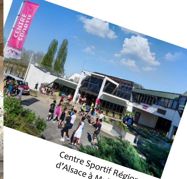
Centre Sportif Régional d'Alsace à Mulhouse