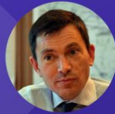
Blaise GOURTAY PRÉFECTURE DE RÉGION GRAND EST