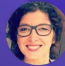
Ghyslaine TIFFAY Directrice de la PFRA Grand Est SGARE de la préfecture de région Grand Est