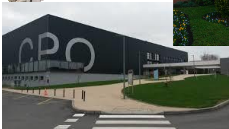
Centre de préparation omnisport de Vittel