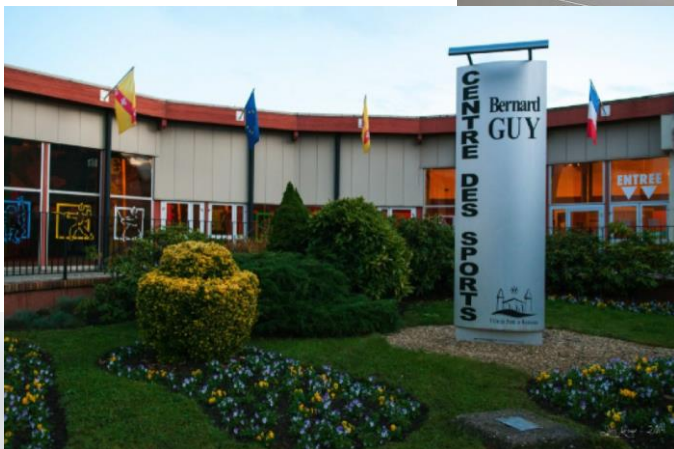
Complexe sportif de Pont-à-Mousson