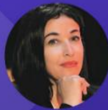
Vice-Présidente déléguée à la compétitivité, à l'innovation et au numérique Région Grand Est