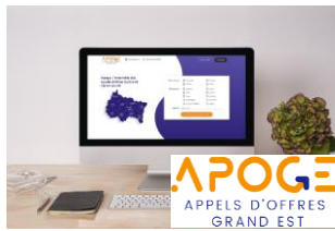
Agrégateur des marchés publics APOGE