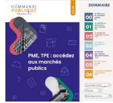
Guides à destination des entreprises et des acheteurs